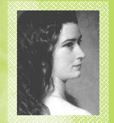
L'imperatrice Elisabetta (1837 - 1898)

Sulle tracce della storia, dai Giardini di Castel Trauttmansdorff al cuore di Merano