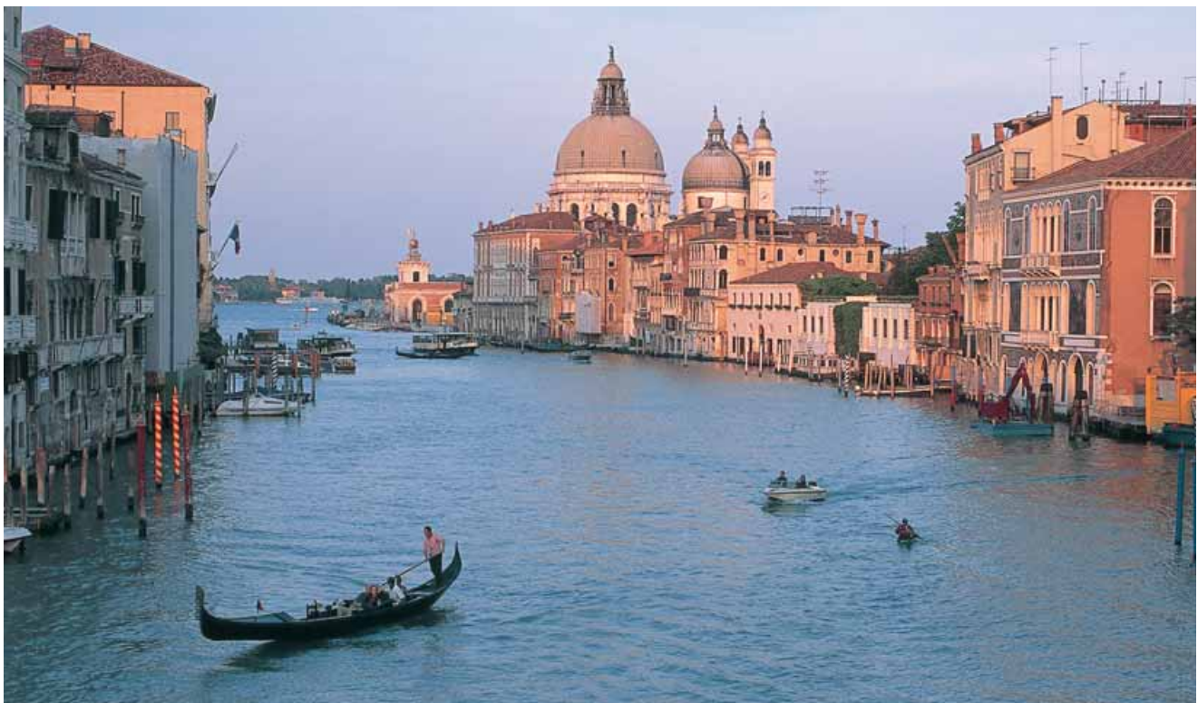
Ook ik zou hier, op het Canal Grande, willen zingen.

Alsof kajaks tijdachines zijn worden we teruggeworpen in de geschiedenis, komen in nauw contact met gotiek, barok en renaissance, om soms terug te keren in 2004. Niet ons 2004 maar een parallel universum zonder auto's. Een koerier laadt vanuit een DHL-boot een doos uit, smalle, lange vrachtschepen laveren geroutineerd door de waterstegen, metselaars balanceren op steigers boven het water, een gelikte jonge manager stapt door een kantoorraam in een motorboot en vertrekt naar een afspraak. Niets echter verstoort de rust in de waterdoolhof. Tenslotte doemt de Brug der Zuchten op. Zelfs als er nog iets van het gezucht der veroordeelden in de lucht zou hangen, op weg van de rechtszaal in het Dogenpaleis naar de gevangenis aan de overkant, zou het overstemd worden door de oh's en ah's van zeker honderd Japanners. Als één wezen hebben ze zich naar ons omgekeerd en leggen ons op video vast. Dan braakt de stad ons uit, even abrupt als