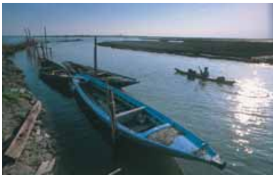
's Avonds is de lagune helemaal voor ons alleen.