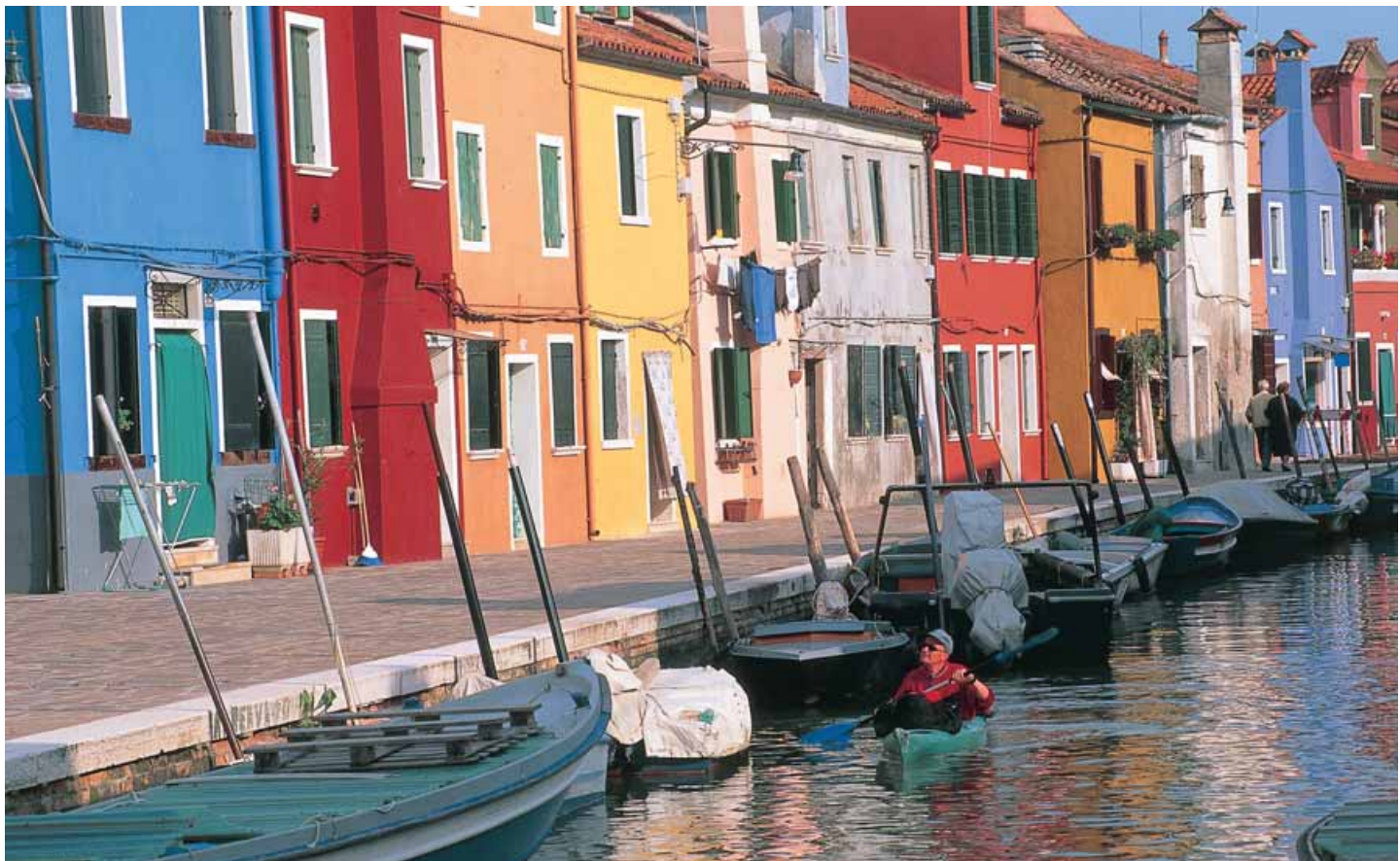
Elk huis is in een andere kleur geschilderd, maar het harmonieert wonderwel.

Dit is geen dorpskerk maar de belangrijkste kathedraal van een grote stad: tienduizenden mensen woonden ooit op dit eiland. Toen de Barbaren het Romeinse Rijk binnen-