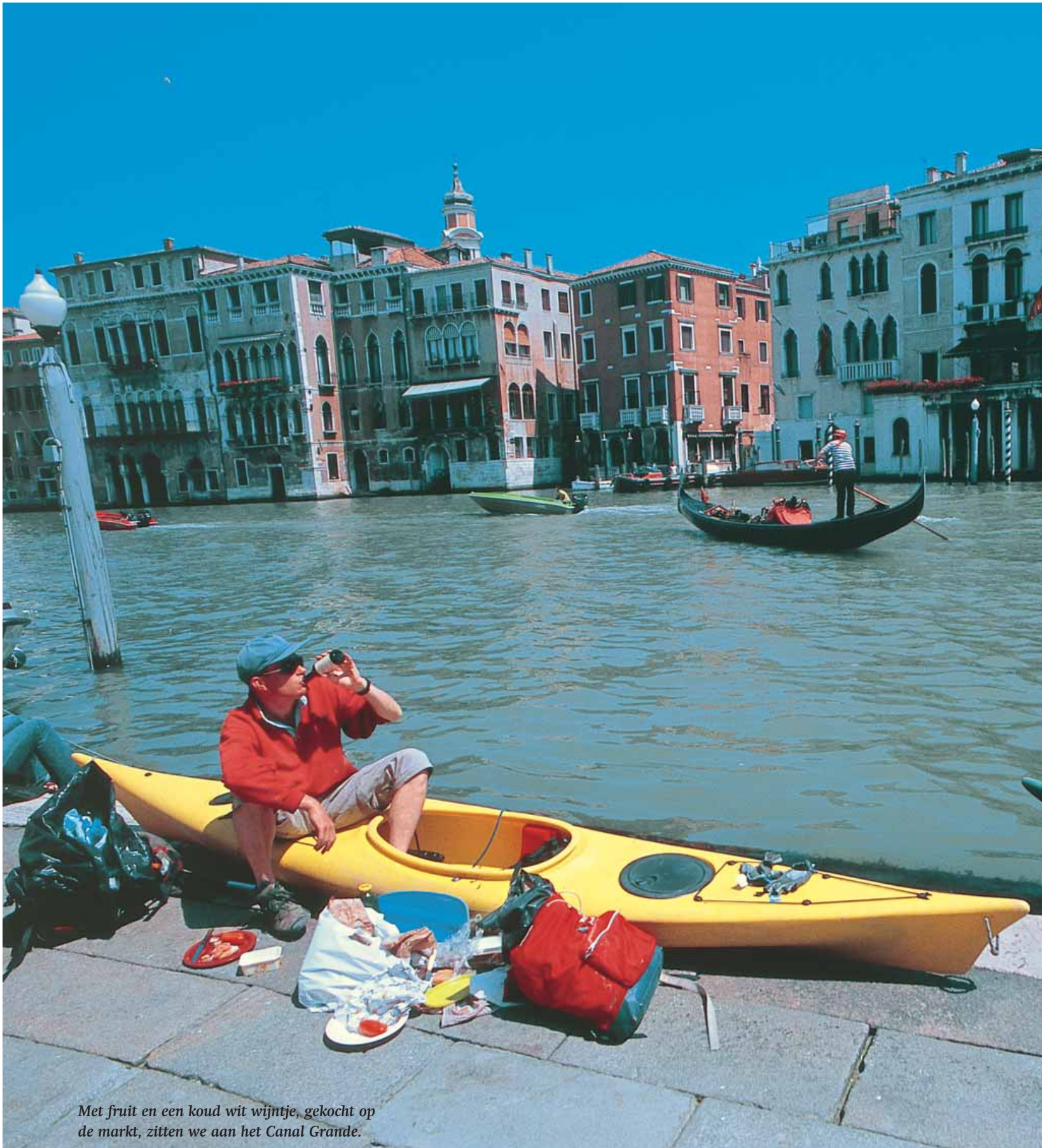
Met fruit en een koud wit wijntje, gekocht op de markt, zitten we aan het Canal Grande.